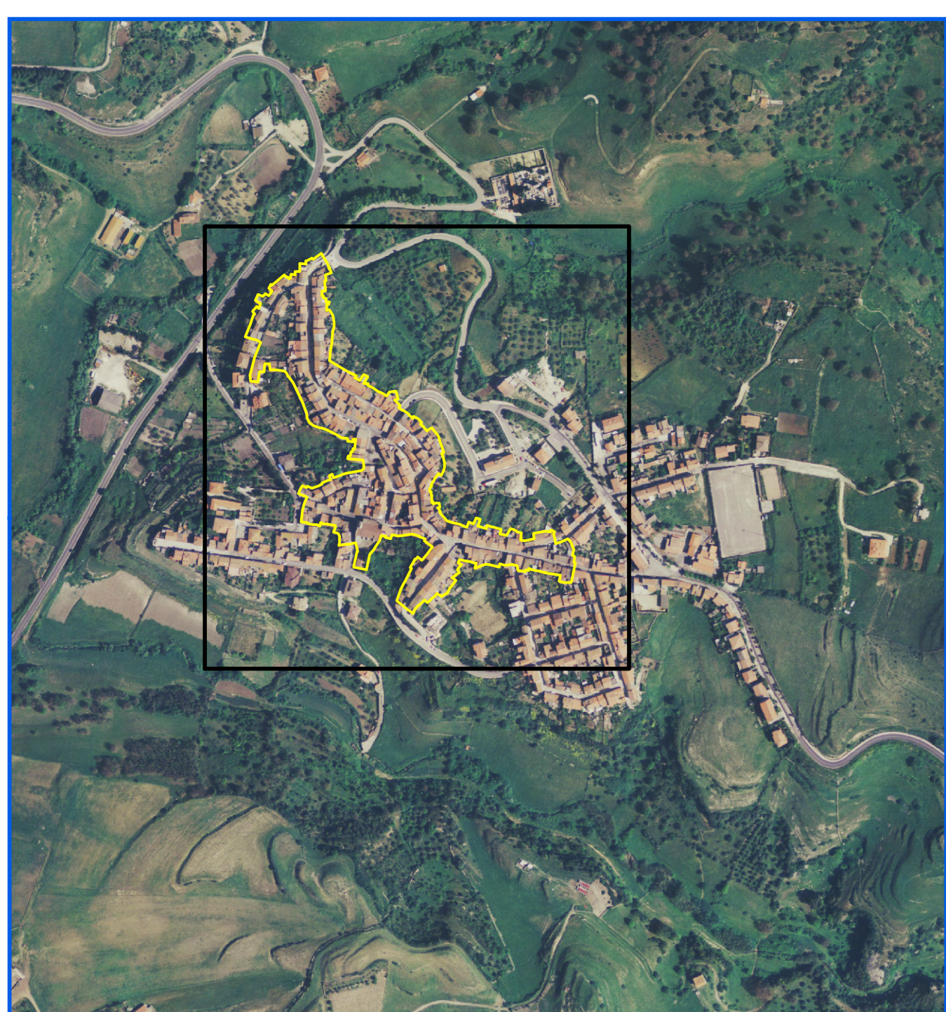
comune di Mara / centro di antica e prima formazione